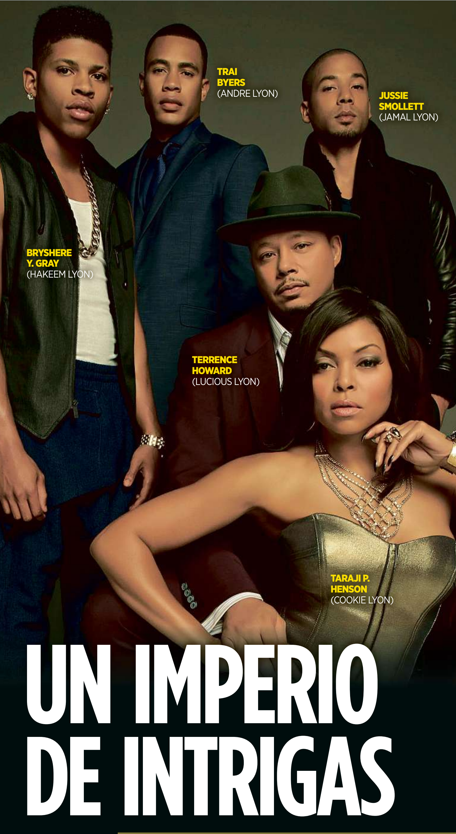
BRYSHERE Y. GRAY (HAKEEM LYON)

“Lo más excitante de esta serie no sólo es hacer una soap-opera muy sexy, divertida, entretenida y jugosa, sino también poder hablar de temas sociales, como el predominio de la homofobia en la industria musical o los orígenes corruptos de ciertas empresas”, consideró Taraji P. Henson.