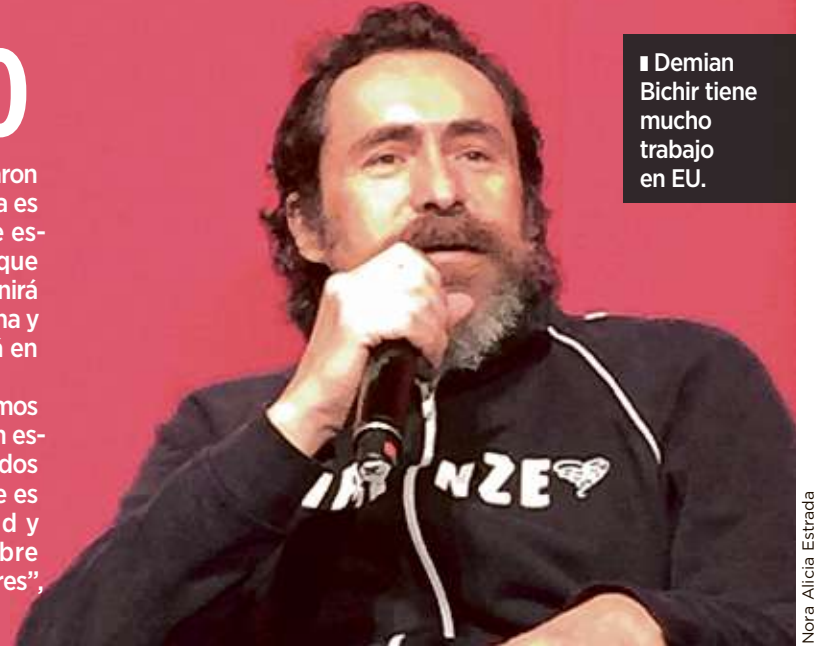
Demian Bichir tiene mucho trabajo en EU.